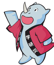
学研災キャラクター サイちゃん