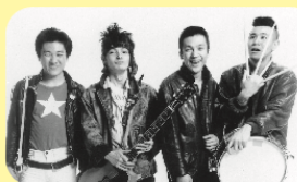
エンディングテーマ THE BLUE HEARTS『夢』

2020年に文部科学省の学習指導要領が「探求学習」に大きく舵を切りました。30年も前から「探究学習」を実践する認可校が「きのくに子どもの村学園」です。子どもの村学園に長期取材したドキュメンタリー映画『夢みる小学校』に、中学生パートを追加撮影した『夢みる小学校・完結編』の登場です！文部科学省選定映画『夢みる小学校』が、さらにアップデートしました。