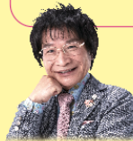
尾木 直樹 (教育評論家)