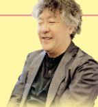
茂木 健一郎 (脳科学者)