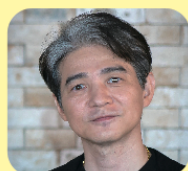
ナレーション 吉岡 秀隆