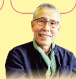
辻 信一 (文化人類学者)