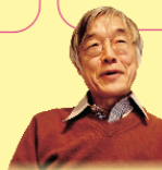
高橋 源一郎 (作家)