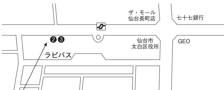
地下鉄長町南駅前のりば (太白区役所前)